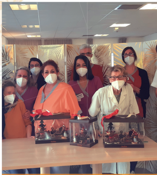
Merci à Yves Thuriès pour le don du chocolat

Sophie, la nouvelle animatrice, nous a rejoint ce mois-ci avec de nouvelles activités comme les ateliers réminiscence tous les jeudis et les revues de presse tous les mardis. Le loto sera également à l'honneur les vendredis. Bon mois de mars !