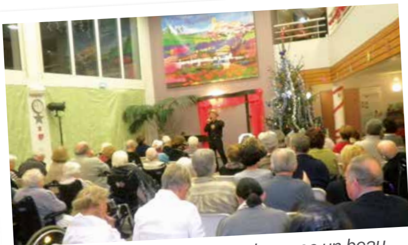
Des fêtes de fin d'année réussies avec un beau spectacle musical.