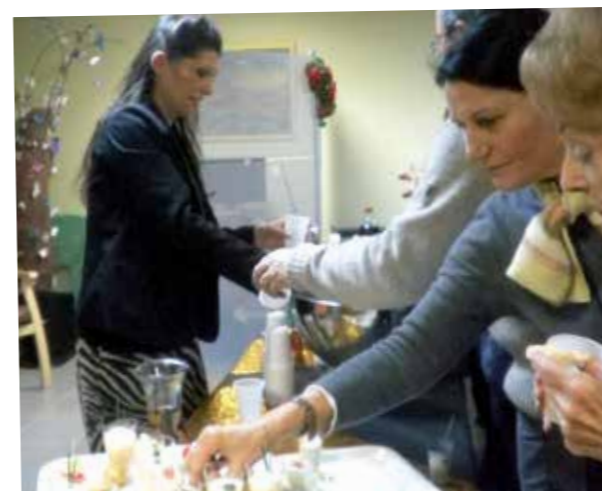
Un apéritif de Noël très apprécié, riche en goût et en couleurs !!