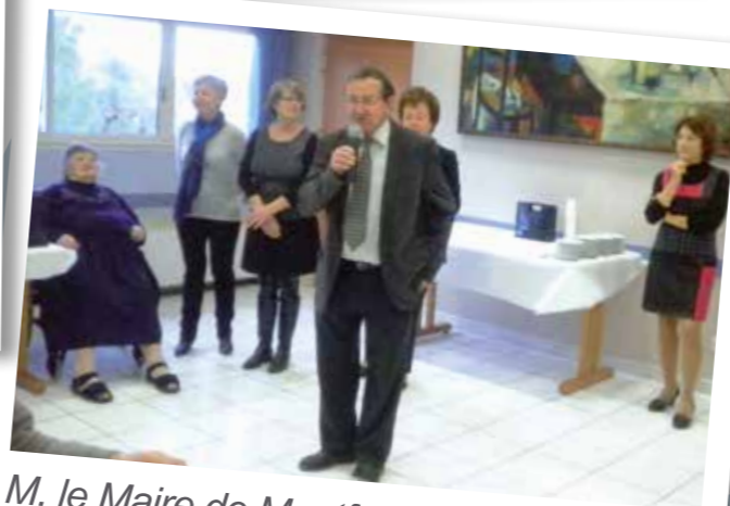
M. le Maire de Montferrier-sur-Lez et son équipe municipale sont venus présenter leurs vœux aux résidents avec de délicieuses galettes des rois.