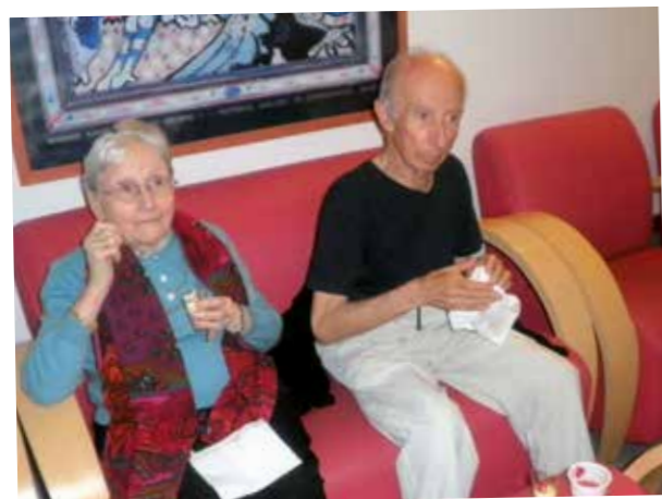
Les résidents se sont installés confortablement pour déguster les petites spécialités de Noël.