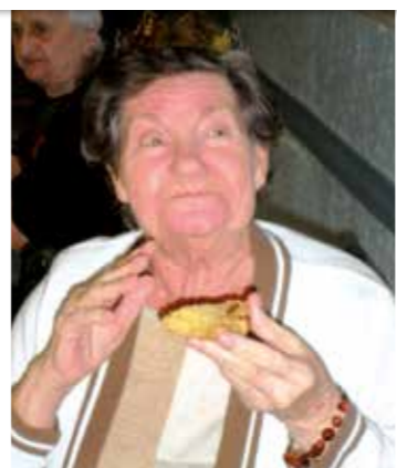
Trouvez les vrais « rois et reines » 2014.