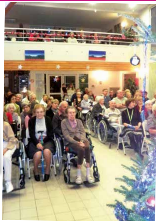
Salle comble à tous les étages et une ambiance festive !!