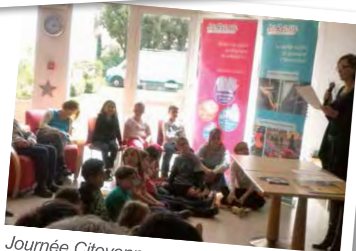
Journée Citoyenne sur le développement durable.