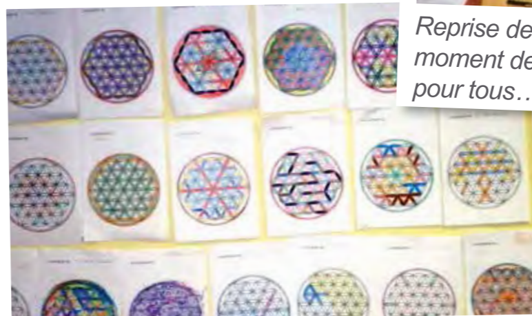
Des réalisations personnelles au profit du collectif.