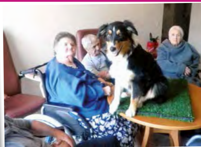
Avec le zoothérapeute, Isy la nouvelle amie des résidents.