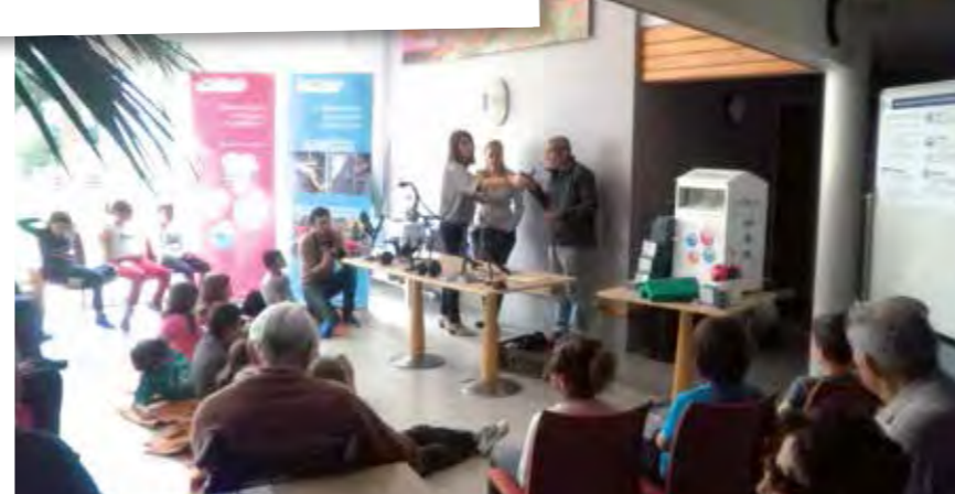
Participation d'un artiste sculpteur en ferronnerie pour illustrer le thème du recyclage.