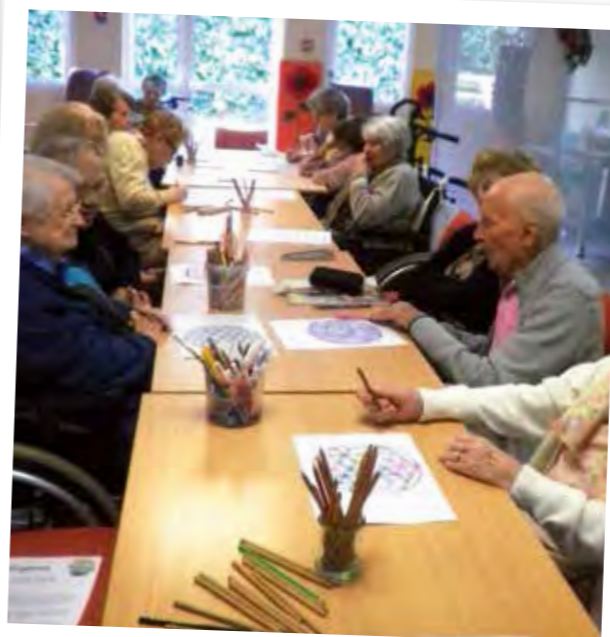
Reprise des ateliers Mandalas, un moment de calme et de concentration pour tous...