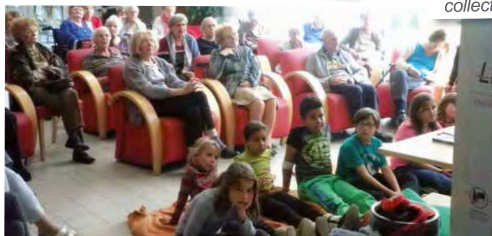
Rencontre intergénérationnelle avec les enfants du Centre Aéré autour d'un délicieux goûter et d'une présentation instructive sur le recyclage pour nos petites têtes blondes !!