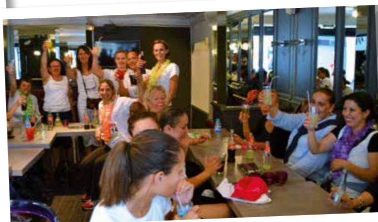
Bien sur, il faut reprendre des forces et fêter l'événement comme il se doit ! Alors encore bravo à tous !