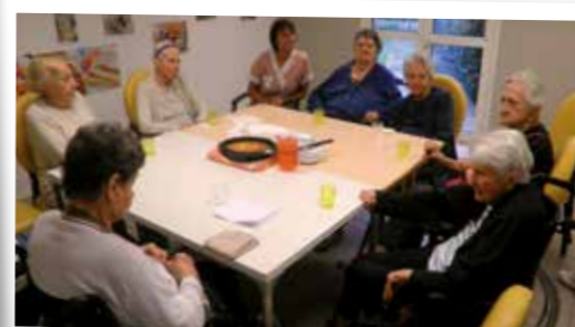
Pour la semaine du goût, des ateliers pâtisserie à la Gloriette.