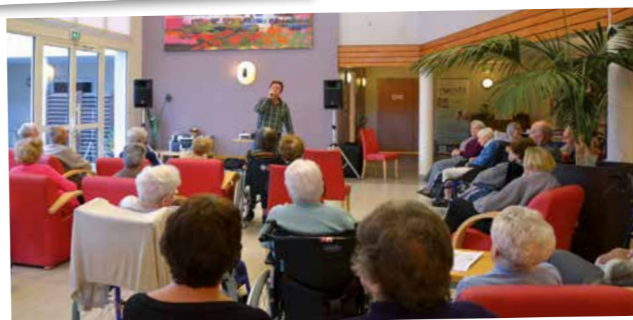
Jean Ferrat à la Résidence !! Des chansons à texte, écoutées dans le silence avec beaucoup d'attention et d'émotion...