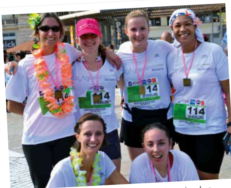
Une équipe lumineuse pour représenter les AIGUEILLÈRES au Marathon de Montpellier organisé au bénéfice des « Restos du cœur ».