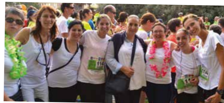
Coureuses et supportrices réunies ! Une exposition de photos est affichée au grand salon.

La « crêpes party » du mois : très sérieux la cuisson des crêpes !