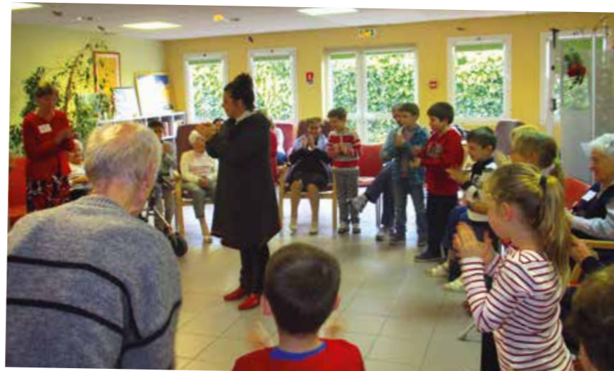
Début de l'échauffement dans la joie et les rires !