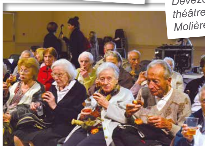
Un après-midi très agréable, qui s'est terminé par un délicieux goûter offert par Elior et partagé entre tous les participants à ce beau projet.