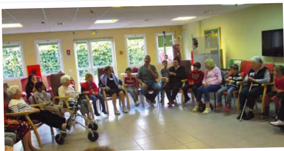
Atelier théâtre à la Résidence avec les enfants du centre aéré de Montferrier.