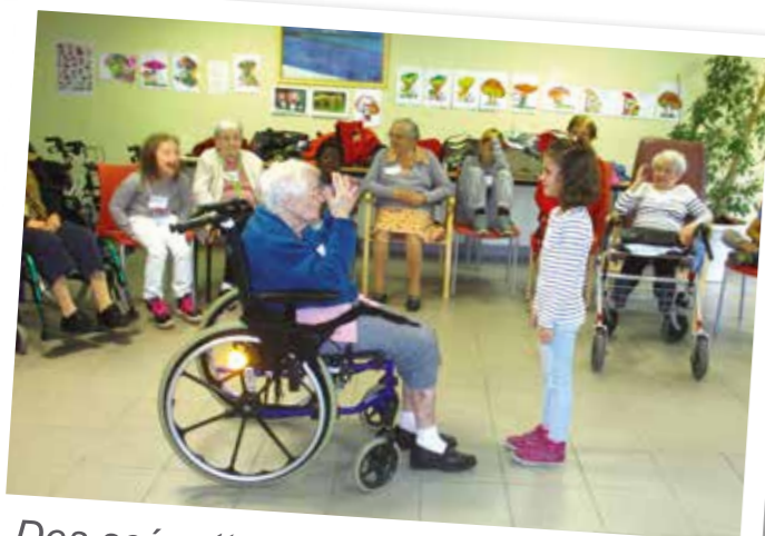
Des scénettes d'improvisation entre les enfants et les résidents avec beaucoup de rires et de la tendresse...