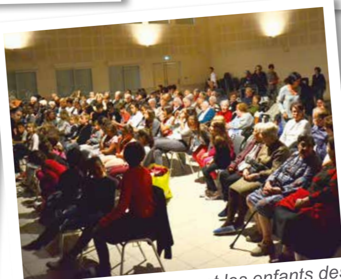
Les trois Résidences et les enfants des centres aérés se sont retrouvés salle Devevou à Montferrier pour la pièce de théâtre « La jalousie du barbouillé » de Molière.