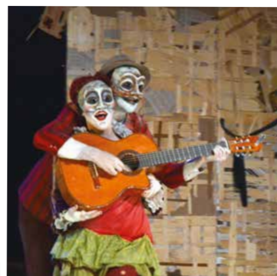
Un beau spectacle tout en couleur et en farce !