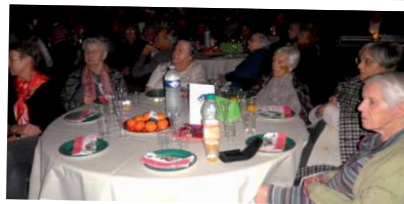
Le spectacle magnifique et le goûter à la salle Devezou, cadeaux de la Mairie, sont chaque année une réussite.