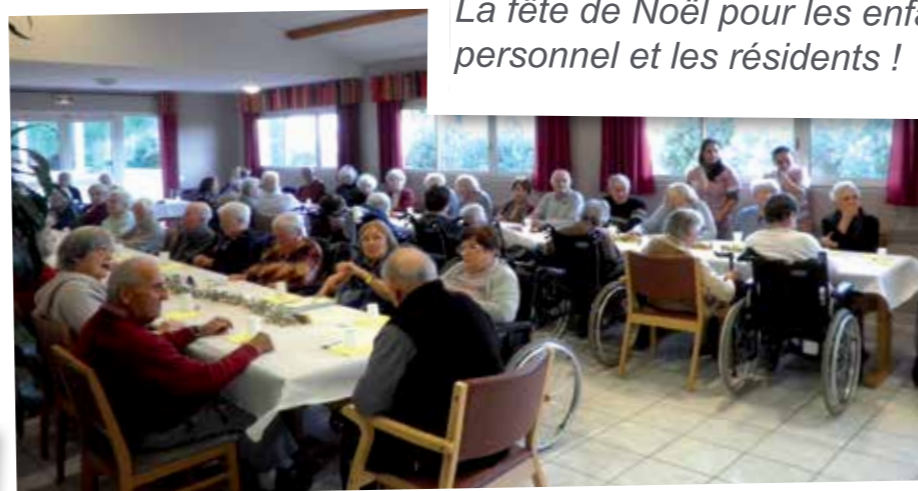
De délicieuses bûches et un joli discours pour nos aînés !