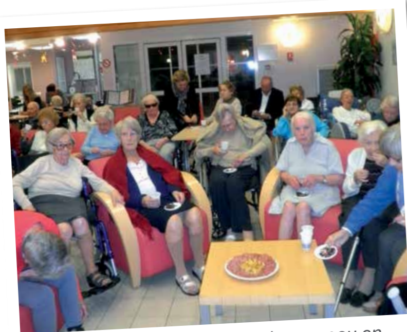
Châtaignes grillées et beaujolais nouveau en musique !