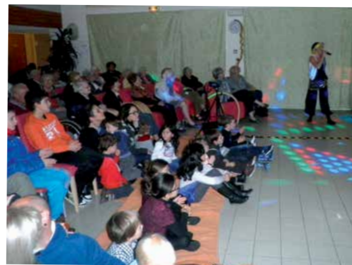
La fête de Noël pour les enfants du personnel et les résidents !