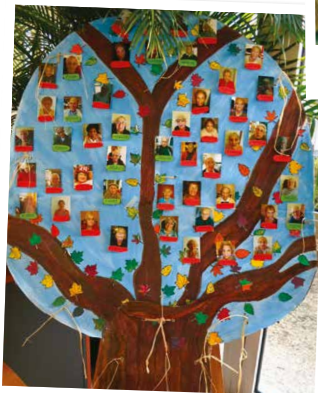
L'arbre d'automne des résidents peint par Mme DELATTRE...