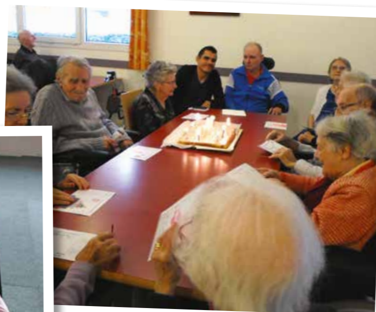
Anniversaires du mois d'octobre...