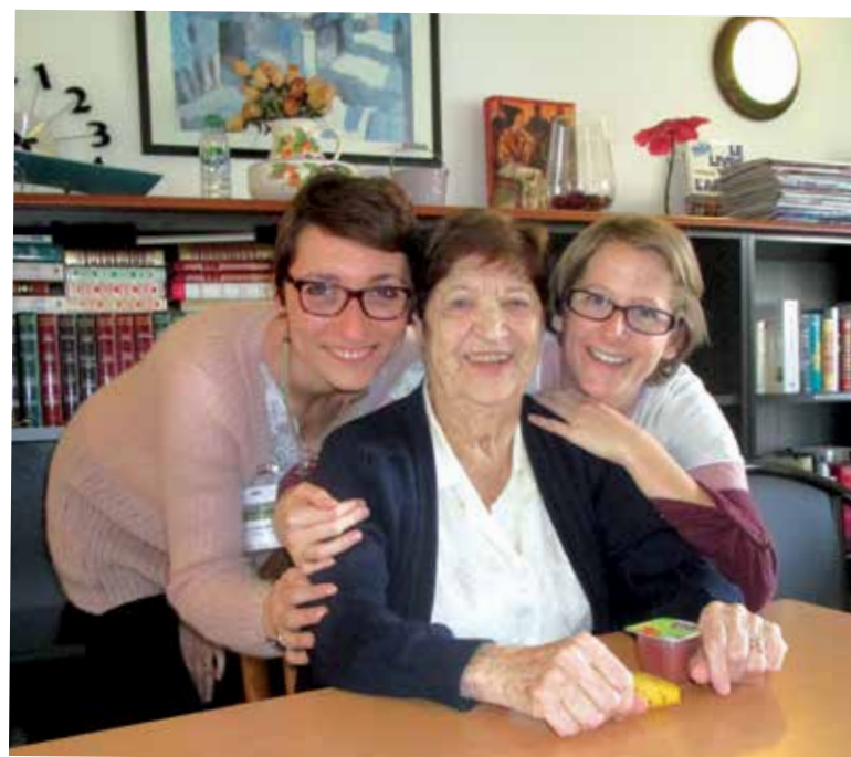
Un repas thérapeutique convivial !