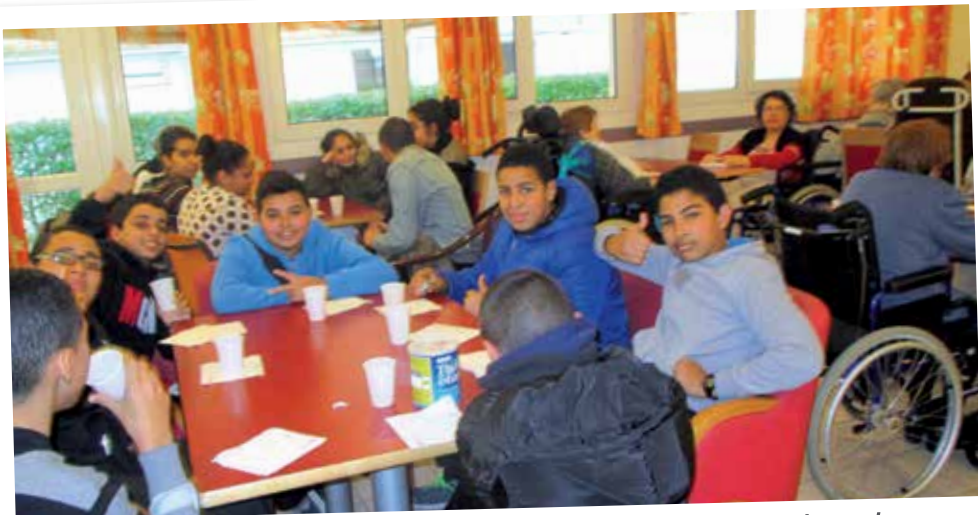
Rencontre avec les jeunes du Collège Arthur Rimbaud pour la découverte des métiers des secteurs sanitaires et sociaux.