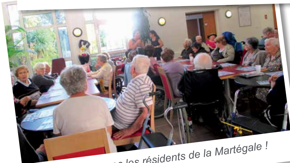
Un loto partagé avec les résidents de la Martégale !