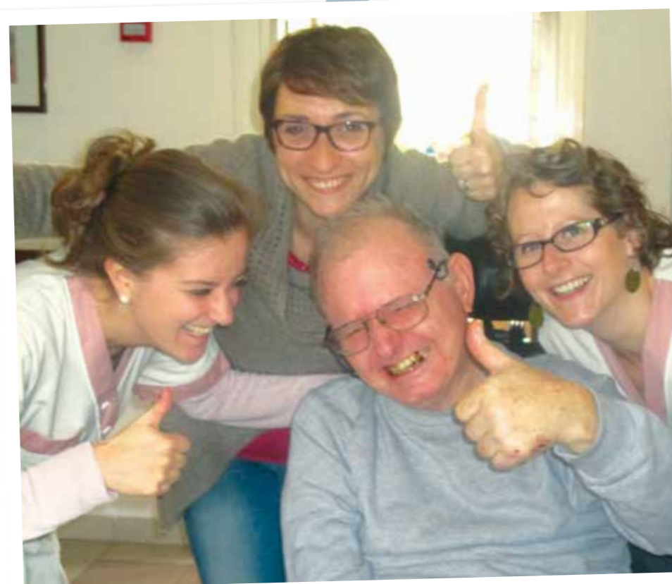
Un fou rire spontané !