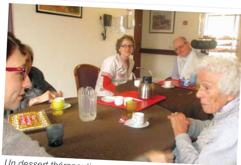
Un dessert thérapeutique avec café et chocolats...