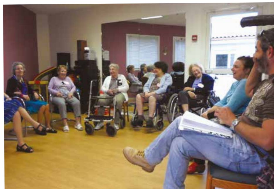
Eclats de rire pendant l'initiation théâtre avec la compagnie « Tête de bois ».