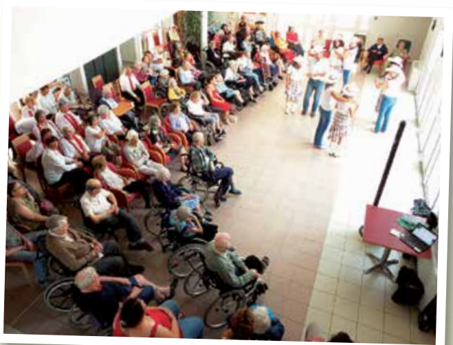
Un public nombreux et conquis !