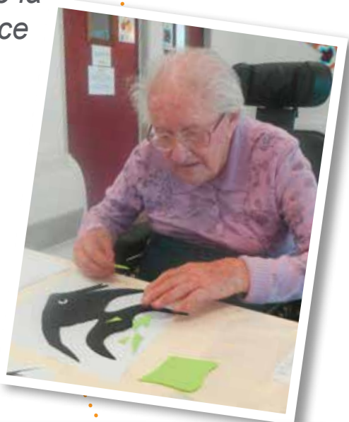
Préparatifs de la fête de la Résidence