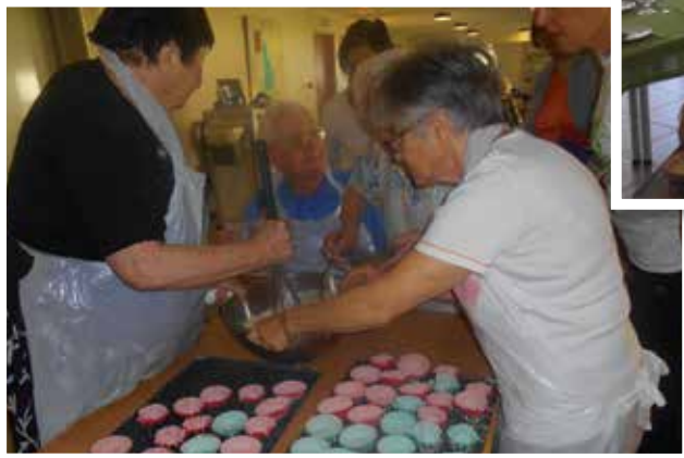
Préparation du goûter