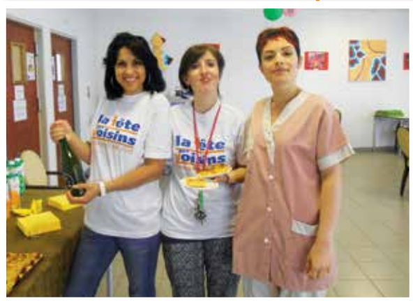
La fête des voisins