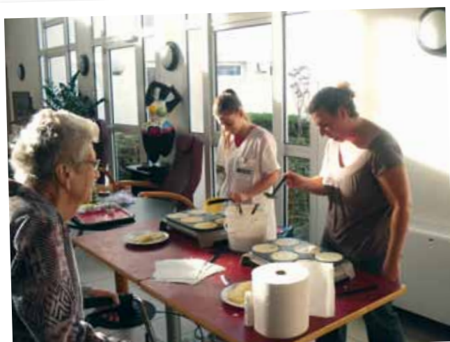
Une petite crêpe party pour le plaisir des papilles de chacun.