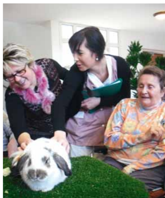
La zoothérapie, un moment apprécié par tous.