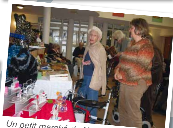
Un petit marché de Noël organisé au sein de la résidence.