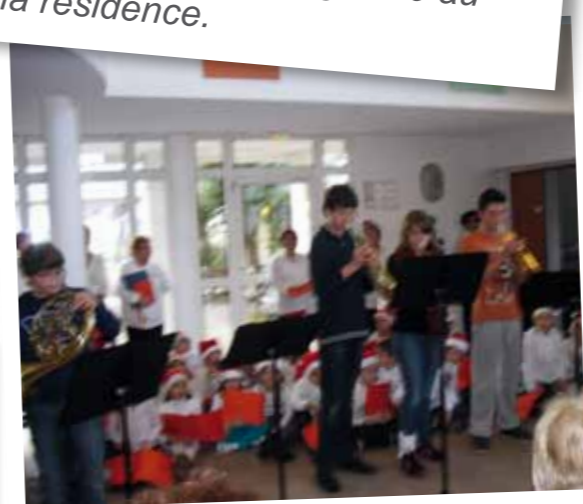
Et même des trompettistes.