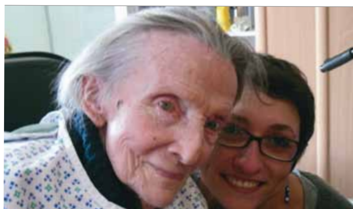
Une complicité et un sourire...