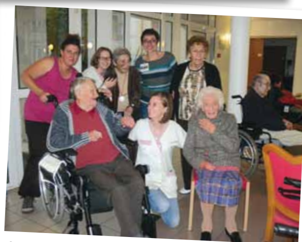
Une photo joyeuse entre personnel et résidents.