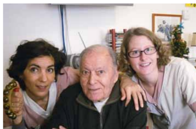
Un repas partagé à l'atelier.