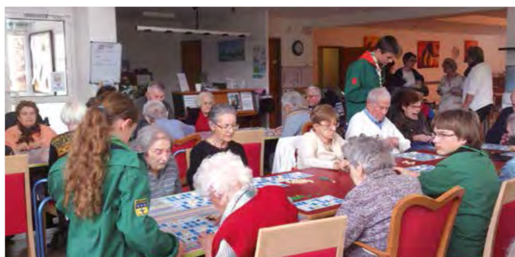
Un loto partagé avec les éclaireurs de France