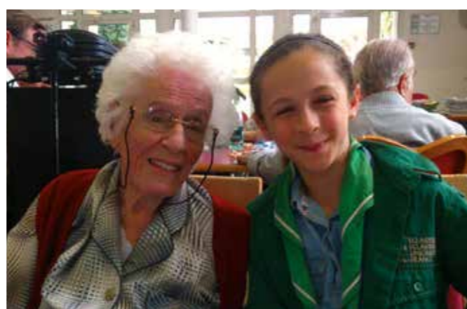
Un moment de complicité.