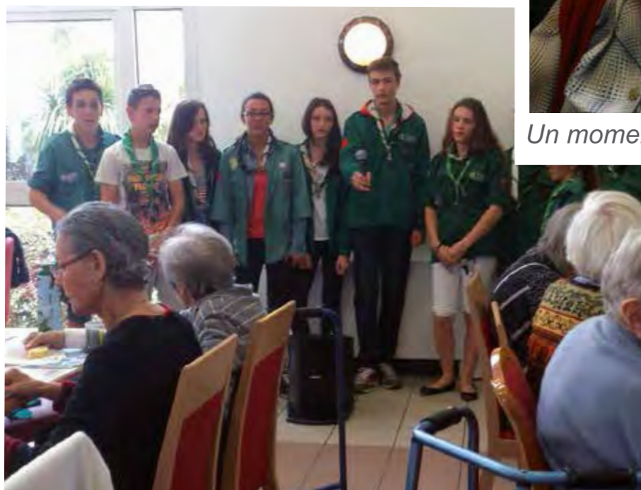
En plus ils nous ont chanté deux petits airs pendant le goûter !