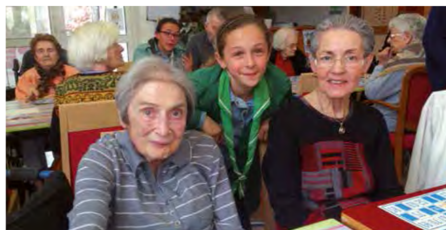
Un sourire ça vaut toujours le coup !