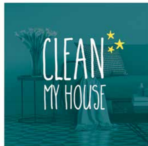
* Nettoyer ma maison

C'est le cas par exemple de l'offre ponctuelle de nettoyage « Clean my House* », disponible sans aucun engagement et que vous pourrez réserver 48 heures avant la date d'intervention souhaitée !