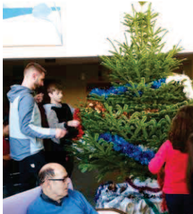
Décoration du sapin de Noël avec les enfants du centre de loisirs de Pérois