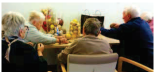
Les lutins de la Martégale en plein travail