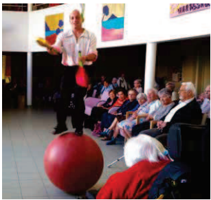
Jonglage sur ballon avec le cirque Piccolino