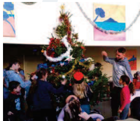
Tous réunis devant le sapin enfin décoré !