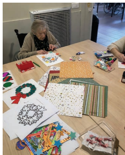
Préparation des décorations de Noël