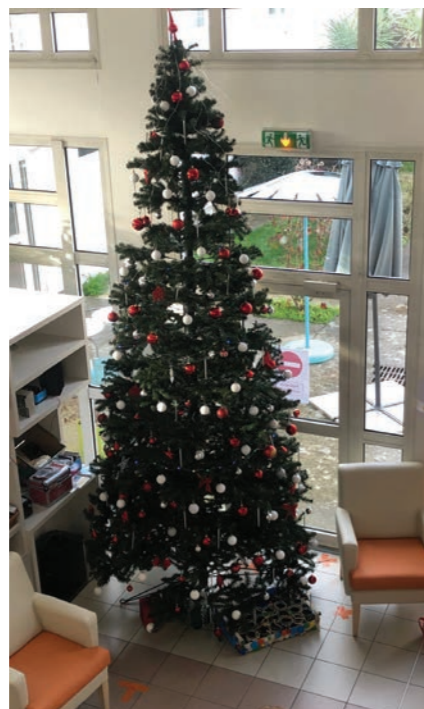
Mon beau sapin