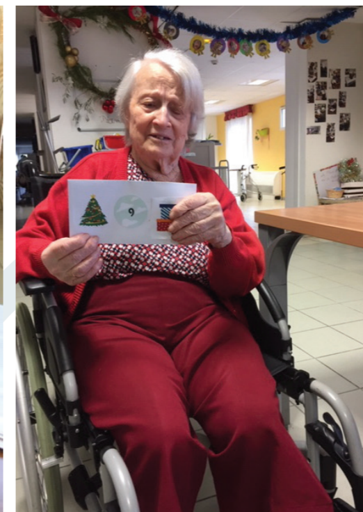
Calendrier de l'Avent réalisé par les résidents