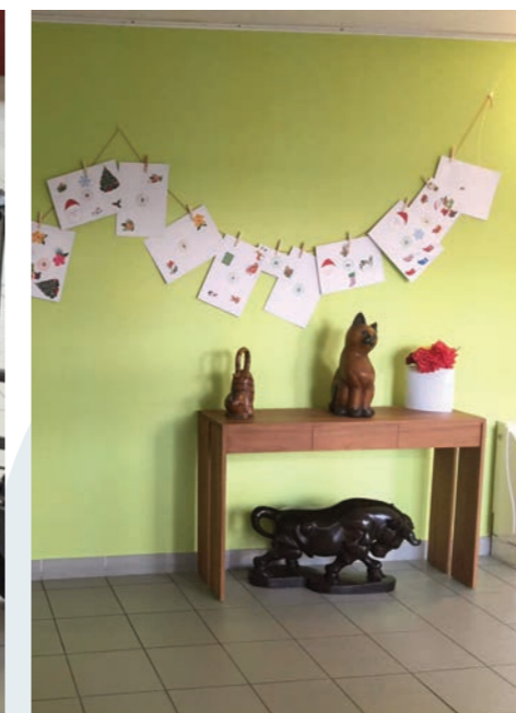
Calendrier de l'Avent réalisé par les résidents