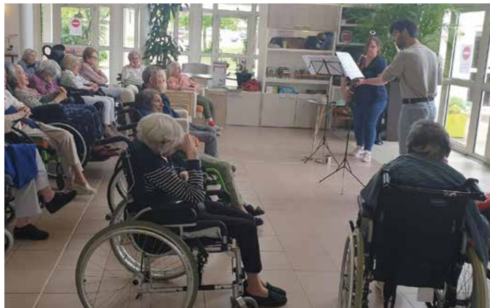
Duo Azur en concert