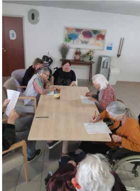
Jeux de mots