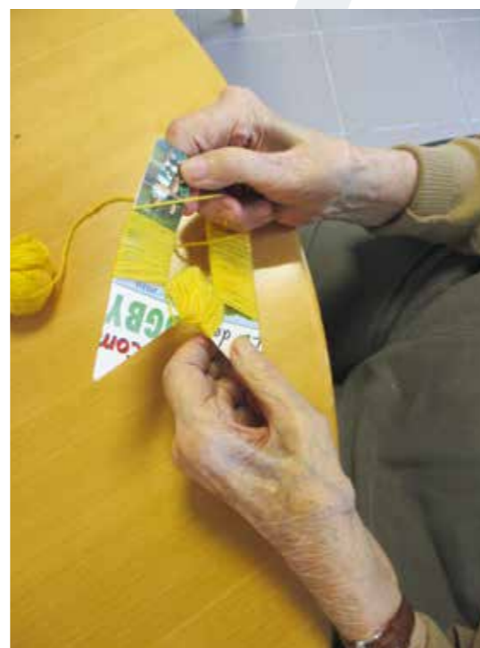
La laine dans tous ses états