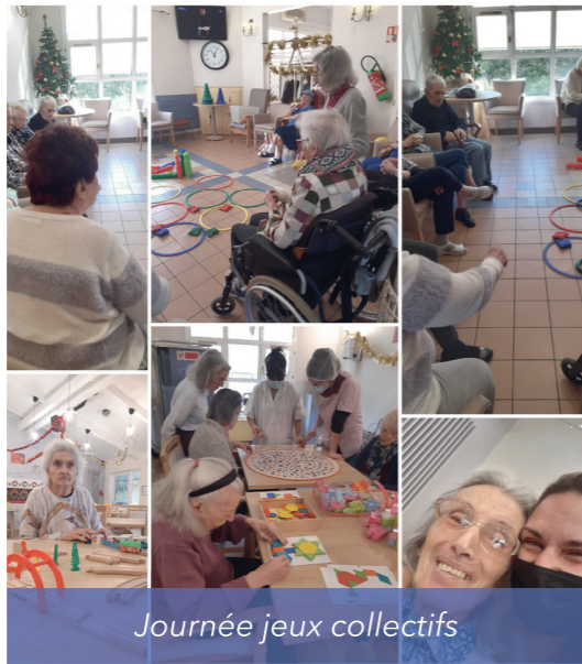
Journée jeux collectifs

Nous allons commencer février à la lumière des chandelles : comme dans les temps anciens, les gens préchrétiens terminaient l'hiver en mangeant des crêpes. Une coutume de la Chandeleur consistait à tenir une pièce d'or dans la main gauche, tandis que de la droite, on faisait sauter la première crêpe. Si la crêpe retombe correctement retournée dans la poêle, on ne manquera pas d'argent pendant l'année.