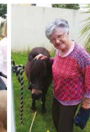
Les Poneys de Pérols sont venus rendre visite aux résidents de la Martégale