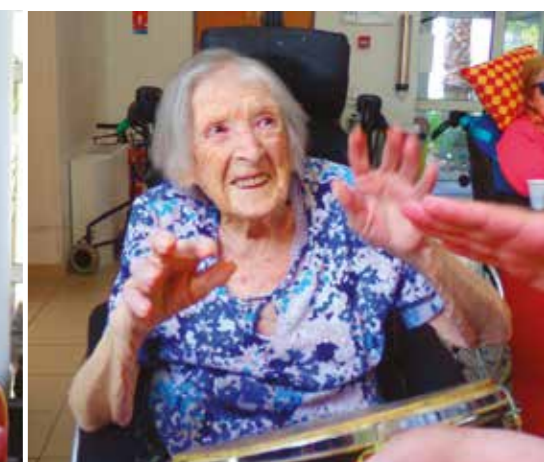
Ah ! la musique Brésilienne quand ça vous tient...