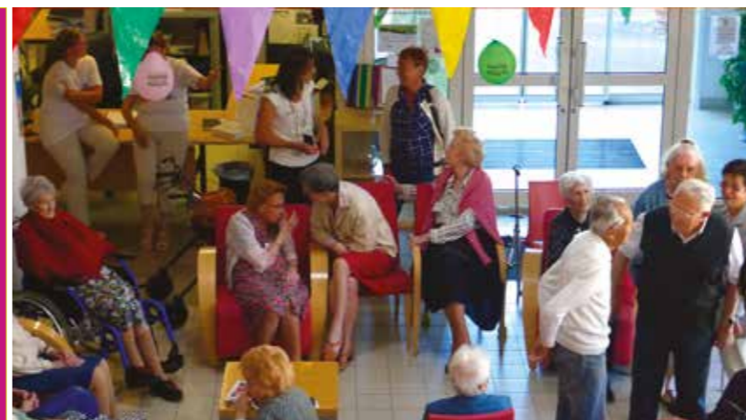
Fête des voisins, un moment très sympathique entre générations.