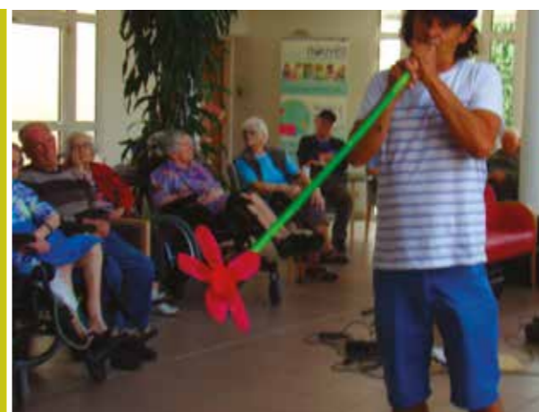
Instrument fabriqué avec une gaine et une bouteille de soda...