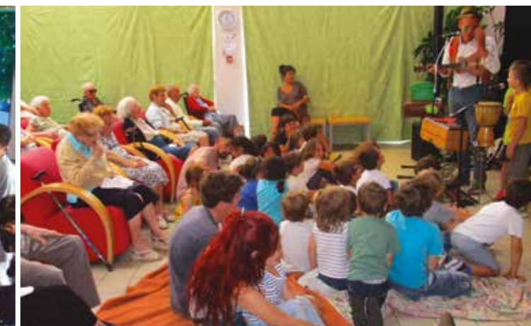
Spectacle plein de poésie pour animer la journée du développement durable