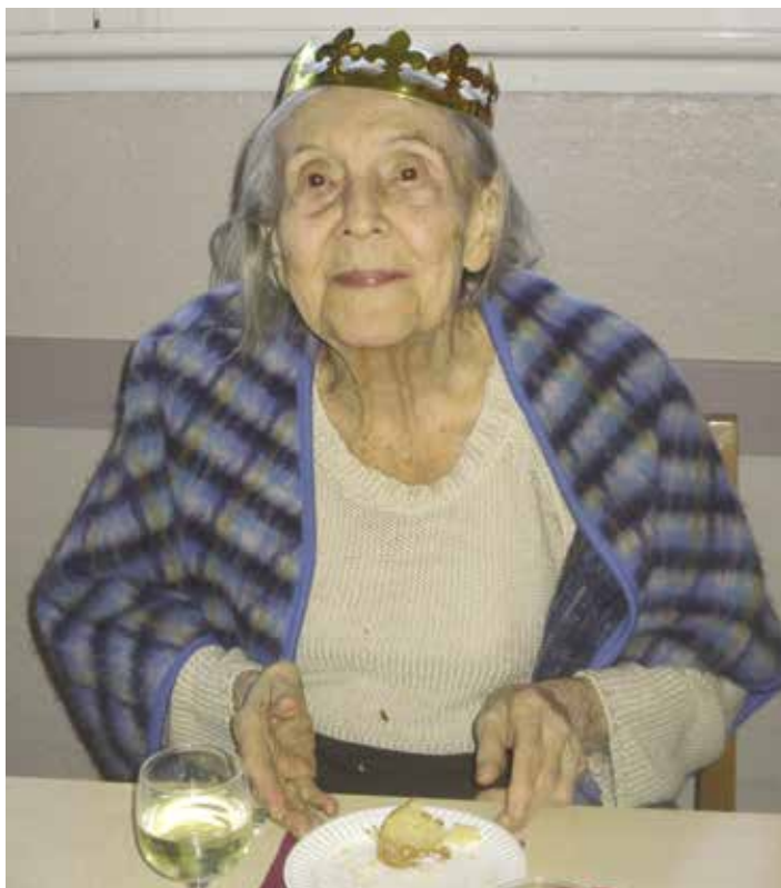
Le couple royal

Madame Mermet a été couronnée le temps d'un goûter le temps d'un goûter festif