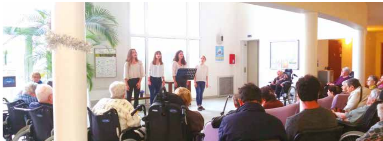
Spectacle à la Résidence avec « Le Groupe Canopée »