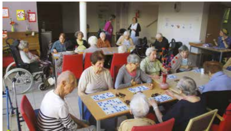
De nombreux participants au loto