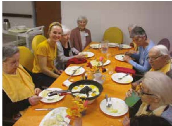
Quel régal les œufs !