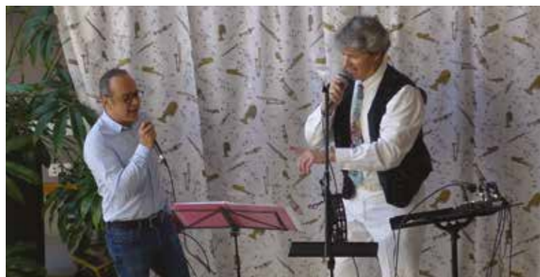
Un beau duo masculin