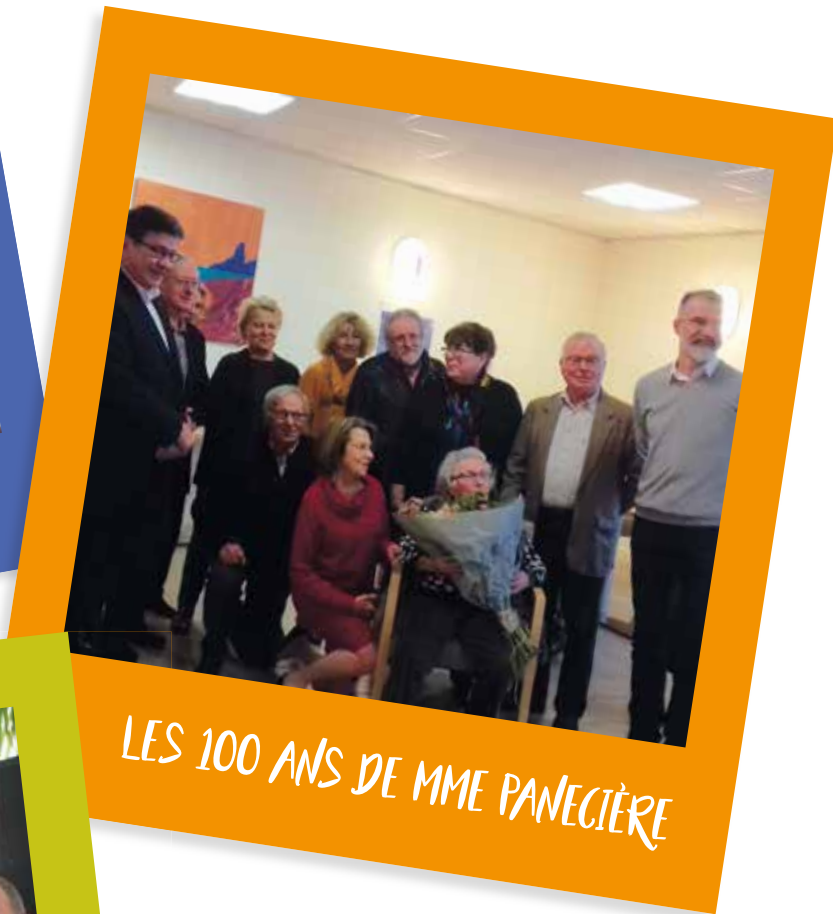
LES 100 ANS DE MME PANECIÈRE