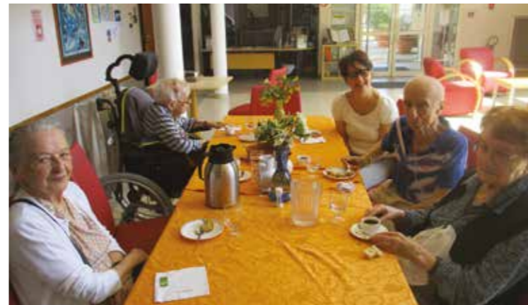
Repas convivial du jeudi au salon