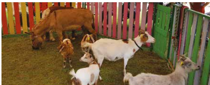
Ah, l'odeur de la ferme...