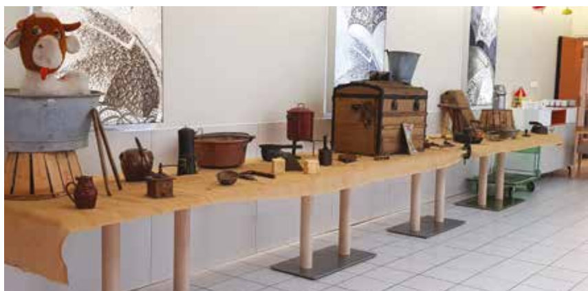
Exposition d'objets sur le thème de la campagne