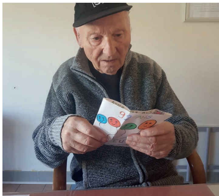
Un anniversaire bien fêté avec 92 bougies