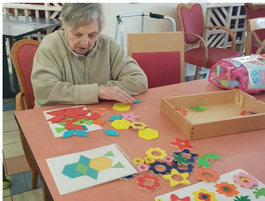
Très concentrée au puzzle