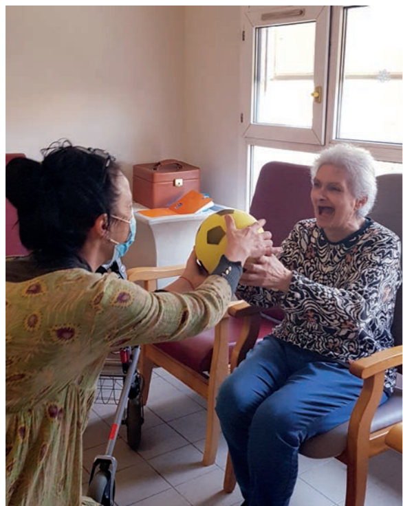
Joli moment de complicité dans le jeu