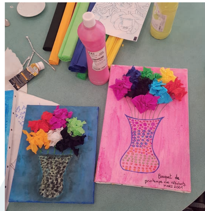
Créations artistiques sur le thème des fleurs.