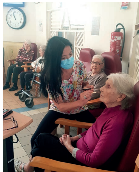
La douceur charme l'âme !