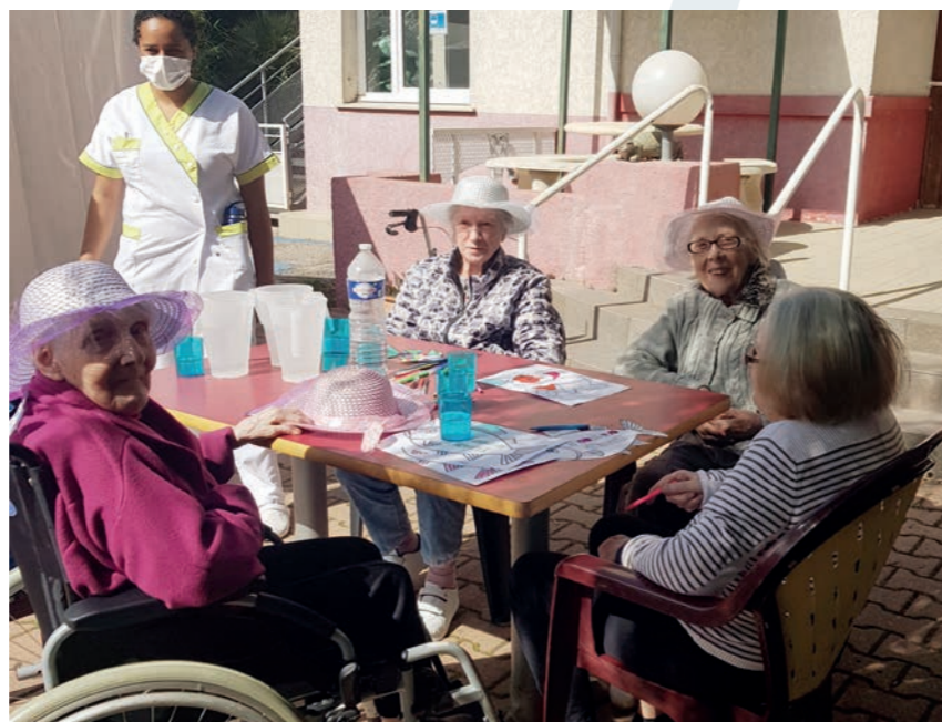
En pleine activité mais au soleil !