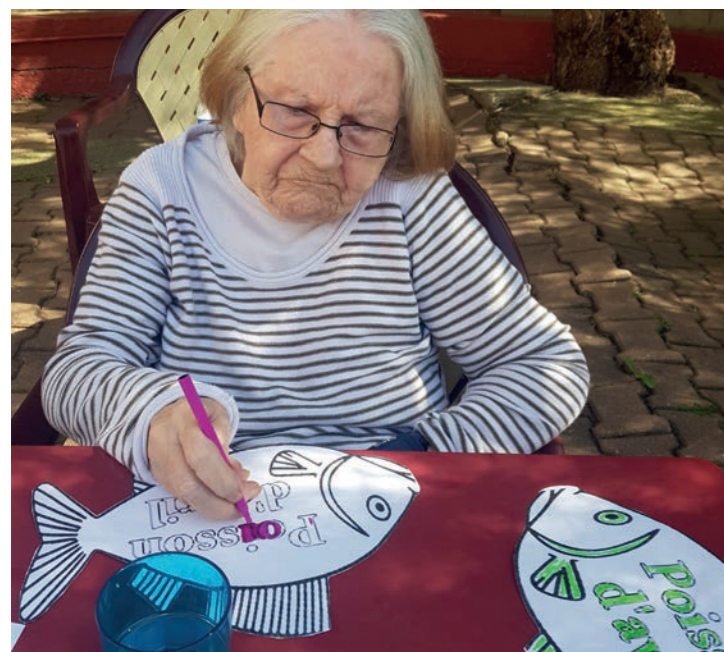
Arrivage de poissons frais, plaisanteries imminentes !