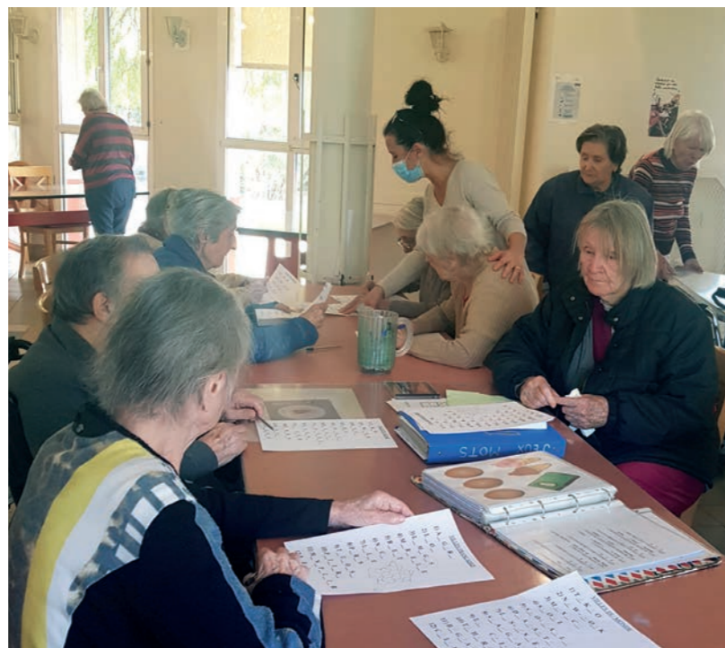
Si la pensée est le travail de l'esprit, la mémoire en est le capital !