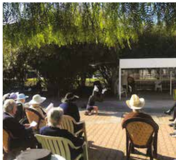
Les résidents profitent de la douceur du mois de mars