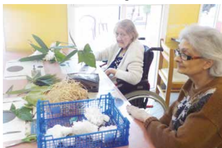
Atelier création de compositions florale pour notre journée africaine