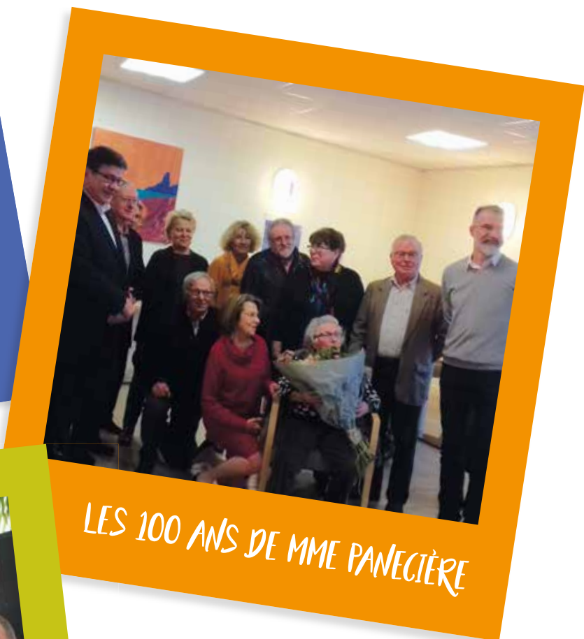
LES 100 ANS DE MME PANECIÈRE