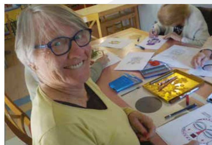
Atelier dessins de masques pour notre journée africaine