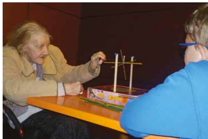
Place aux jeux avec les enfants à la médiathèque de Pérols