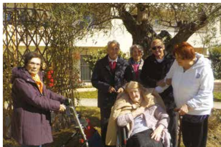
Photo souvenir de notre passage, sous l'olivier, à la « Martégale »