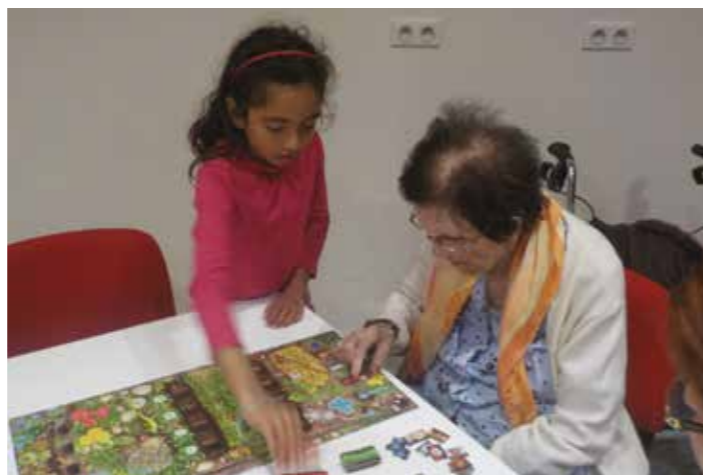
Explication des règles du jeu