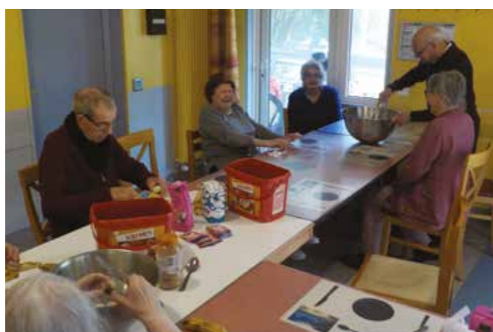
Confection d'un gâteau à la banane