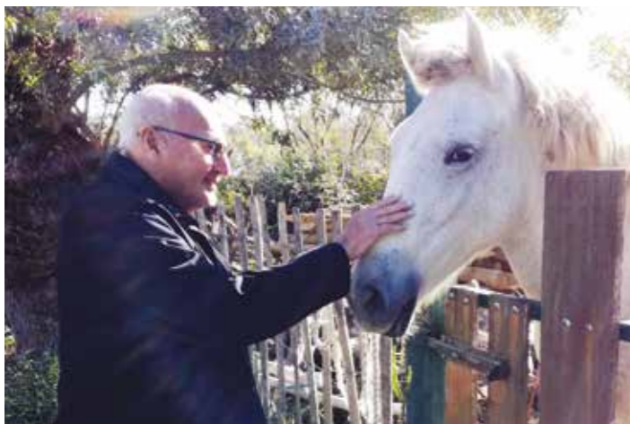
Voici un homme qui sait murmurer à l'oreille des chevaux !