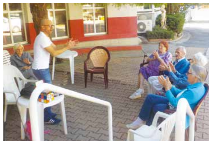
Dans le sud, les Palmas, on connaît !