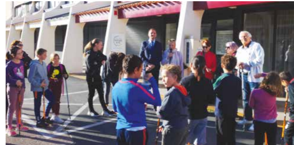
Petit discours avant le départ !