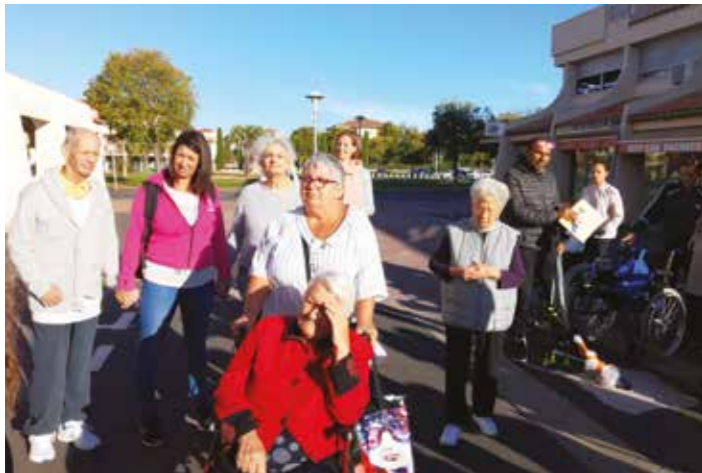
Prêts pour la balade !