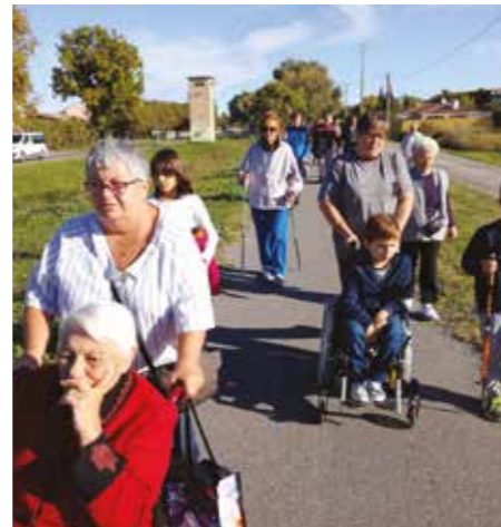
Tous en route pour la balade