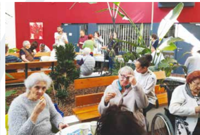
Le grand air, ça creuse !