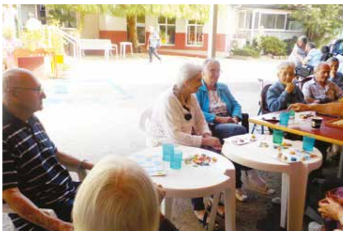
Un Loto « ensoleillo !! »