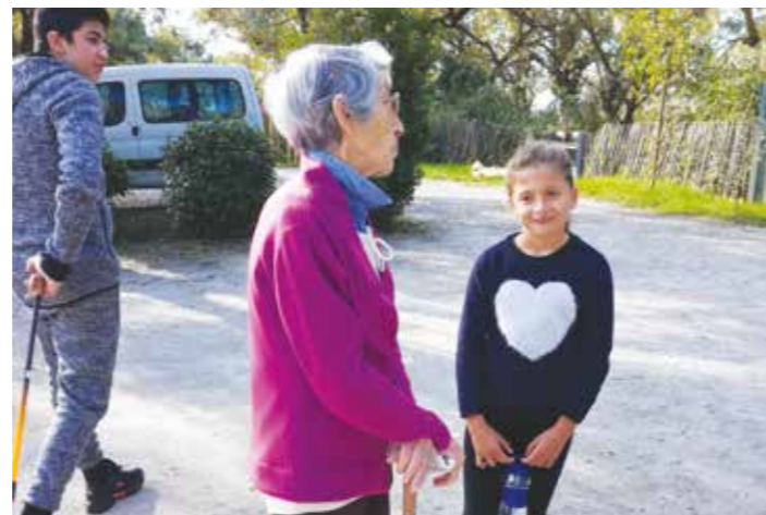
Un coup de cœur intergénérationnel !