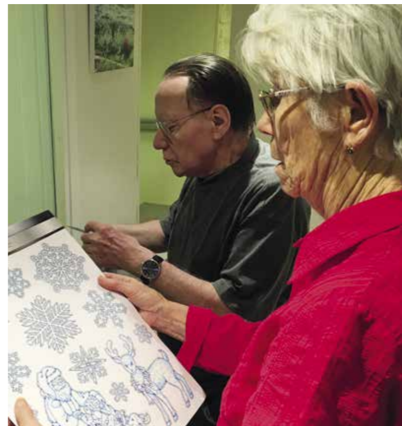
Notre équipe déco à l'œuvre !