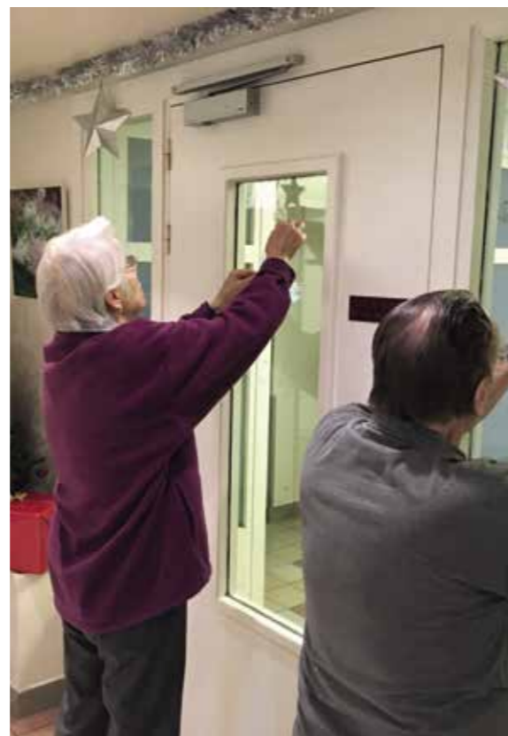
On peaufine !