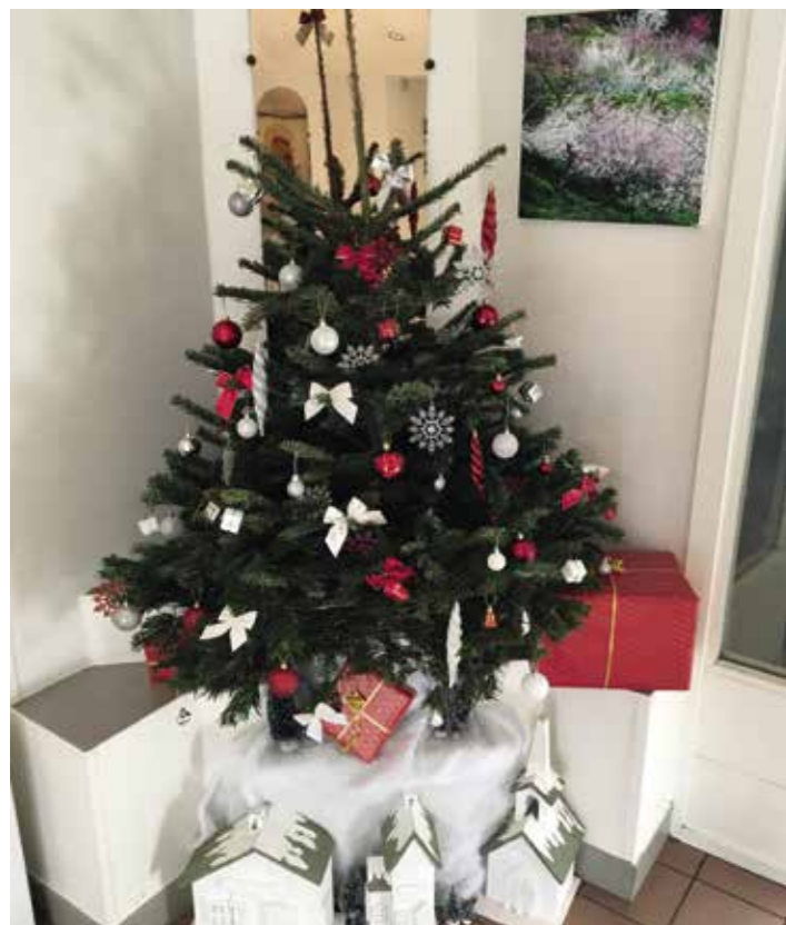
Mon beau sapin !