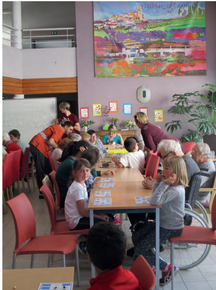
Loto gourmand intergénérationnel