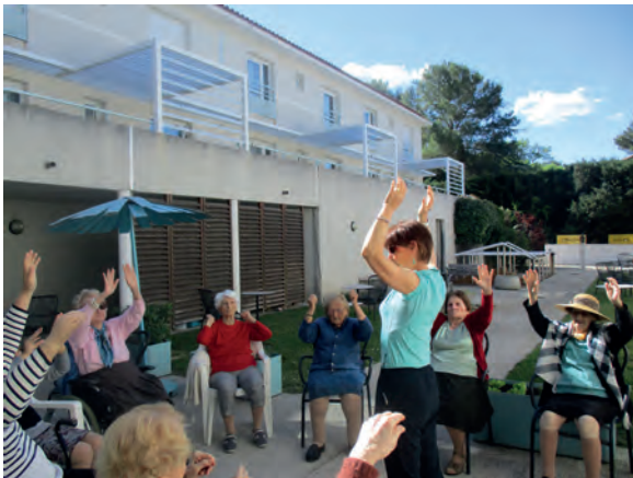
Gym au soleil