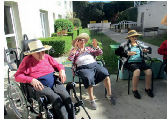
On se protège du soleil, c'est la gym en chapeau