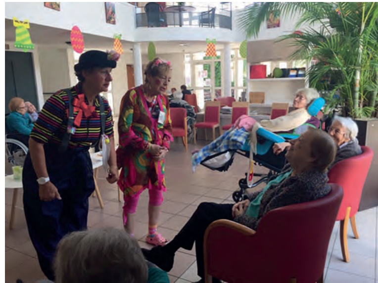
Prêts pour la chasse aux œufs