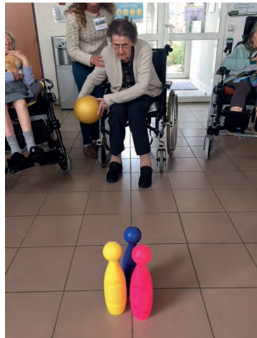
Activités autour des jeux de ballons