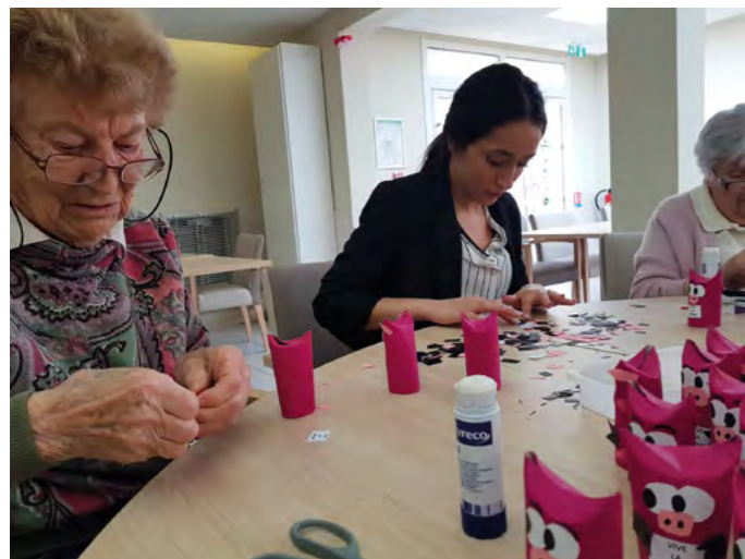
Préparatifs pour la fête de l'été sur le thème de la ferme