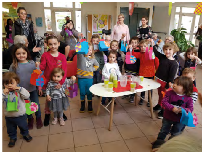
Les enfants sont prêts. Chacun sa poule pour la chasse à l'œuf !