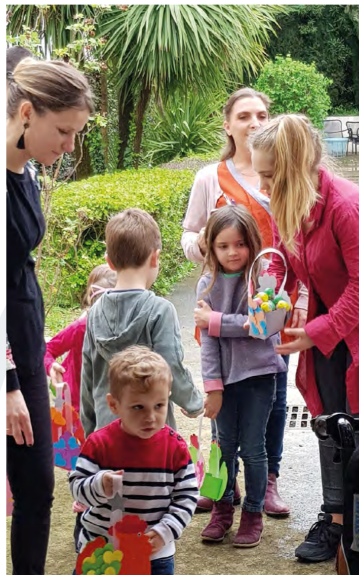
La récolte est bonne !