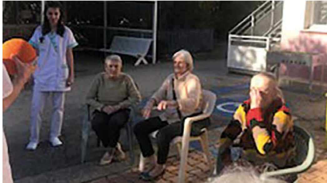
Une après-midi de printemps en février.