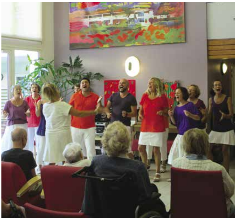
Un chant de joie