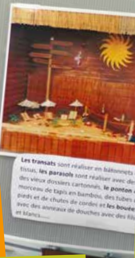
Les transats sont réalisés en bâtonnets de tissu, les parasols sont réalisés avec des vieux dossiers cartonnés, le ponton est un morceau de tapis en bambou, des tubes en bois et de chutes de cordes et les bouées sont des anneaux de douches avec des fils et blancs...