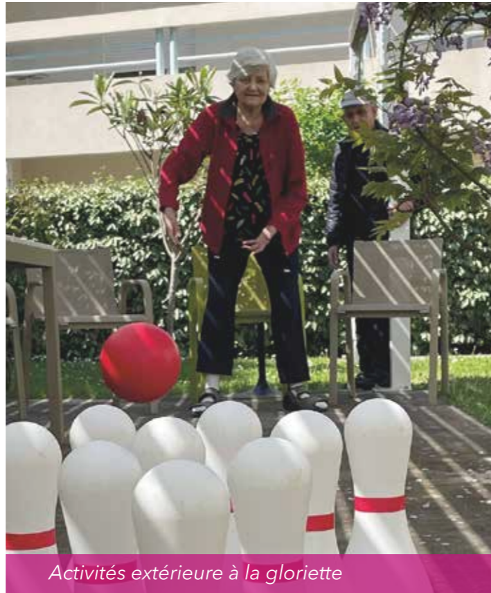
Activités extérieure à la gloriette

Finalement la résidence retrouve sa place dans Pérols.