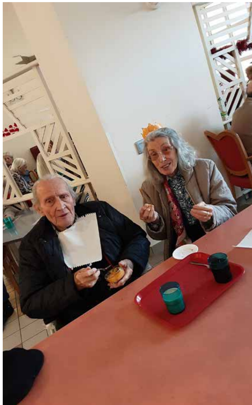
Notre reine et notre roi du jour !