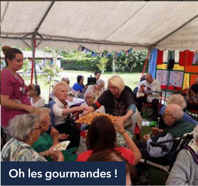
Oh les gourmandes !