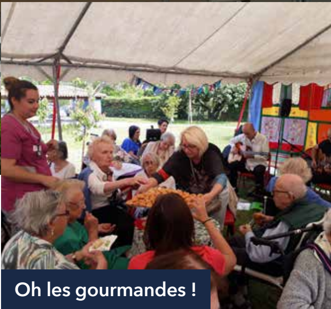
Oh les gourmandes !