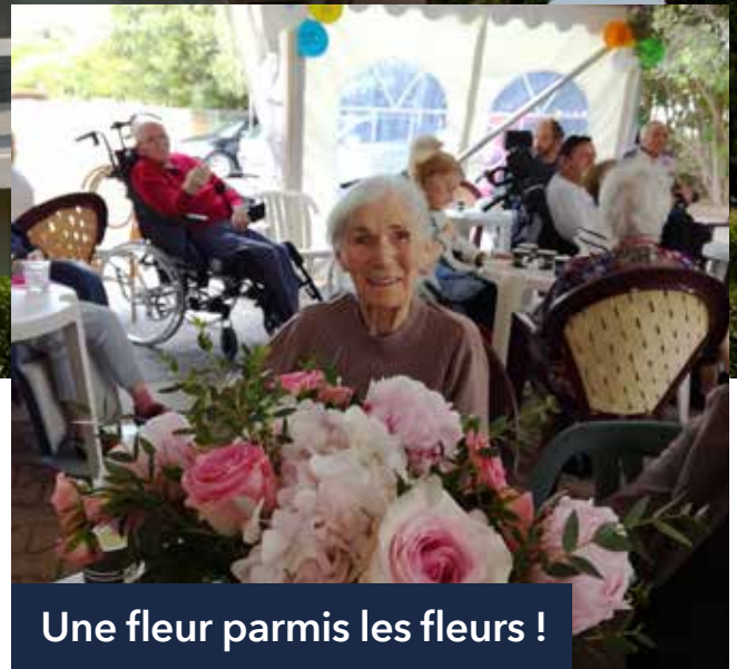
Une fleur parmi les fleurs !