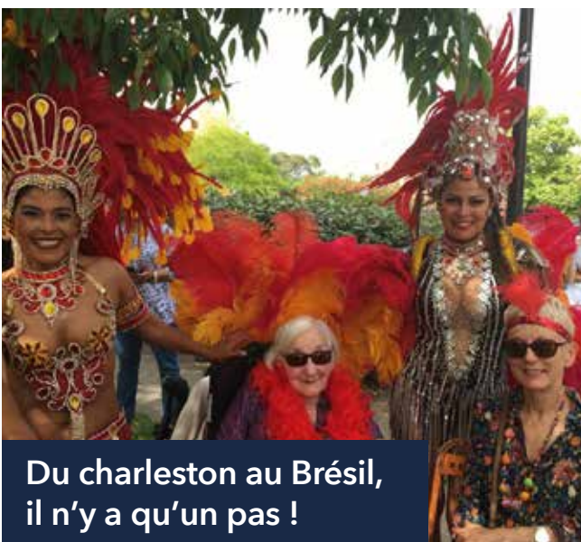
Du charleston au Brésil, il n'y a qu'un pas !