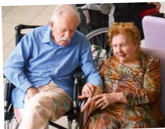
Petit moment de tendresse.