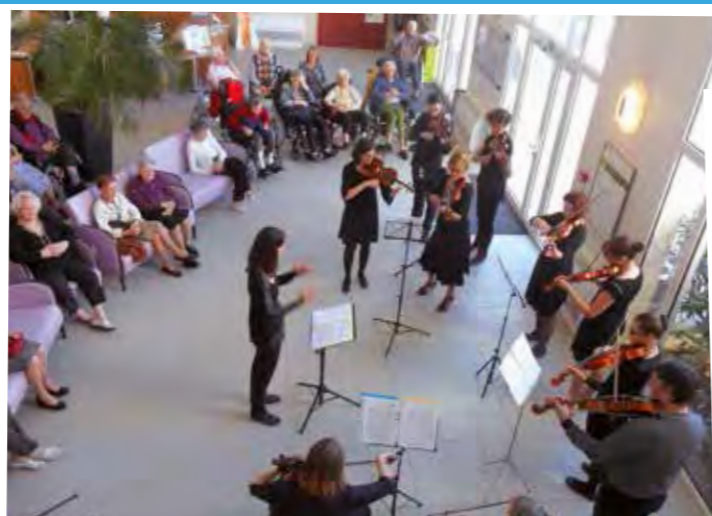
L'école de musique de Pérols nous fait l'honneur de venir nous présenter leur ensemble à cordes.