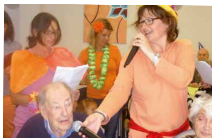
Notre résident en plein chant !