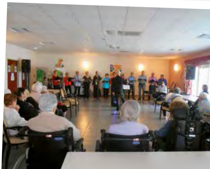
Petit tour de chant avec les ans'chanteurs d'Ariane.