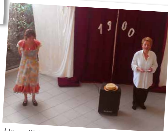
Un petit tour de chant des années 1900.