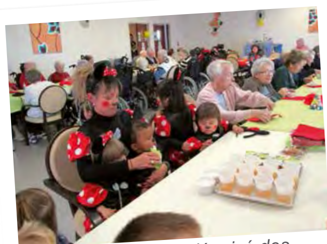
Spectacle chantant déguisé des assistantes maternelles de Pérols / Lattes.