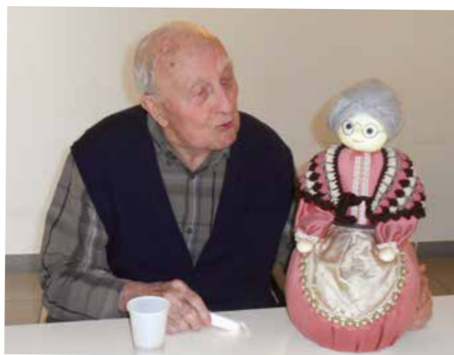
Bonjour Mademoiselle, mais je vous connais !!