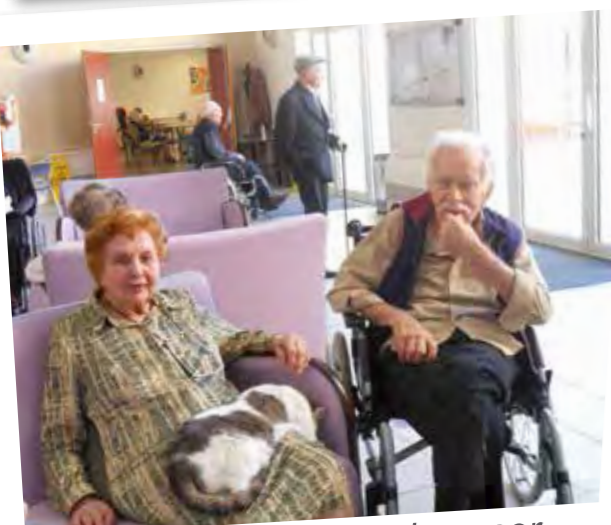
Et nous voilà en train de poser, souriez !