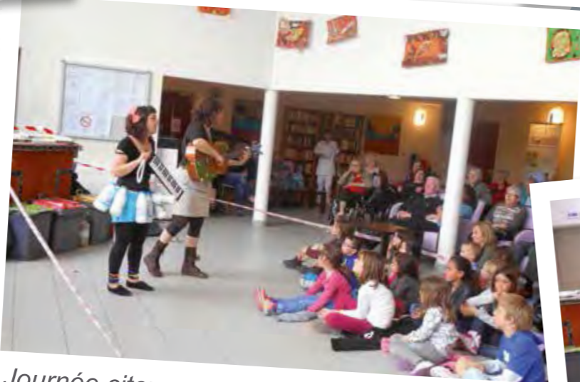
Journée citoyenne, spectacle avec les enfants.