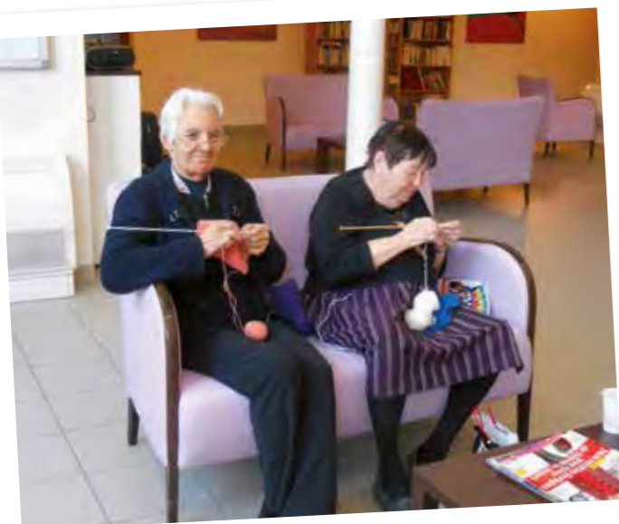
Quel plaisir de tricoter, comme au bon vieux temps...