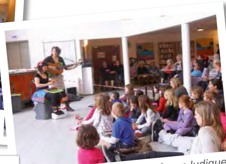
On apprend à recycler de façon ludique.