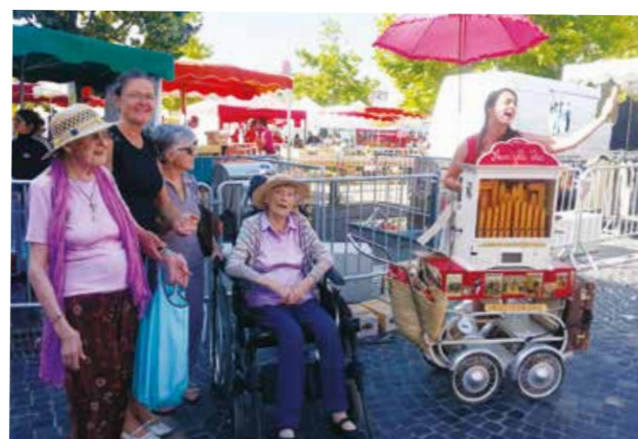
Un tour de chant au marché !