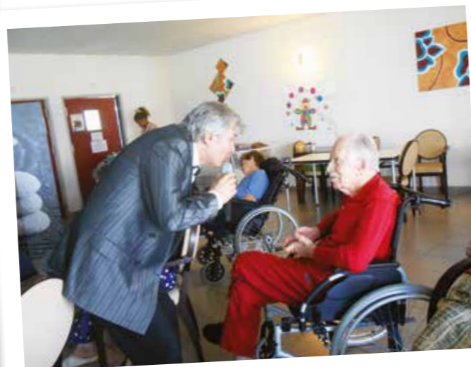
Nous avons toute son attention.