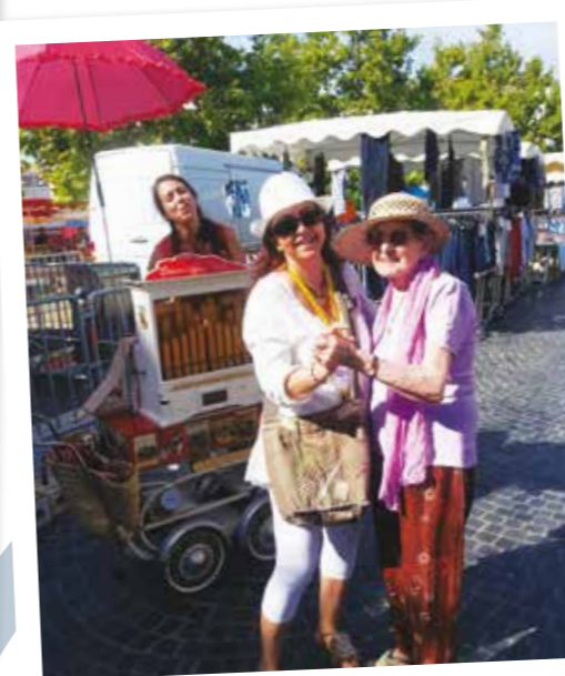
Un petit pas de danse au milieu du marché.