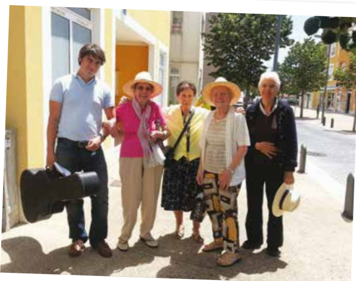
Nous voilà partis pour un tour de chant à l'église.