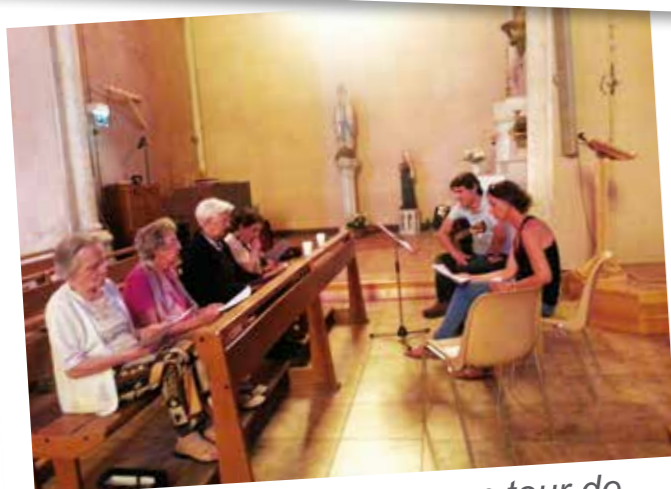
Accueillis à l'église pour un tour de chant.