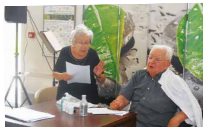
Une petite prestation théâtrale !