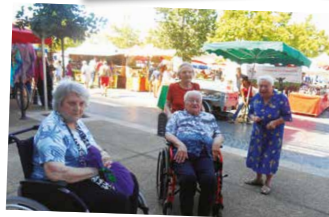
Sortie hebdomadaire au marché.