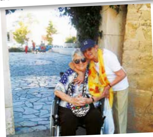
Une belle complicité entre ces deux résidentes...