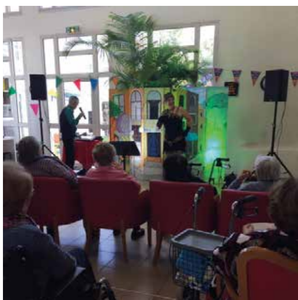
Anniversaire du mois avec Ysad'is.