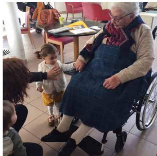
Une nouvelle copine pour Colette.