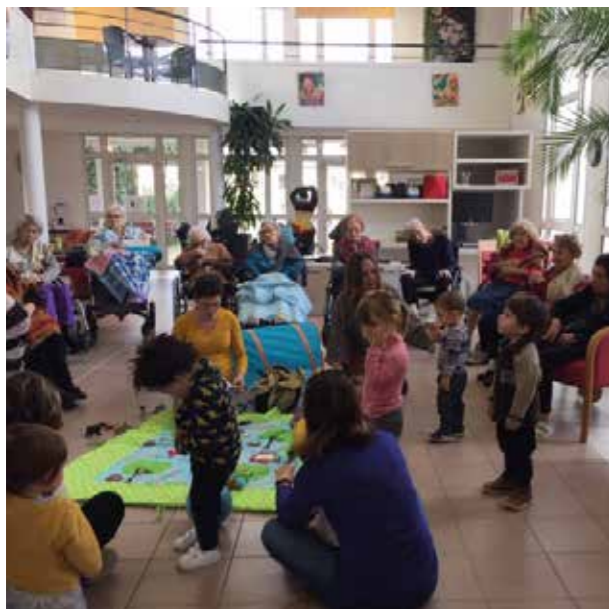
Arrivée de la petite troupe.