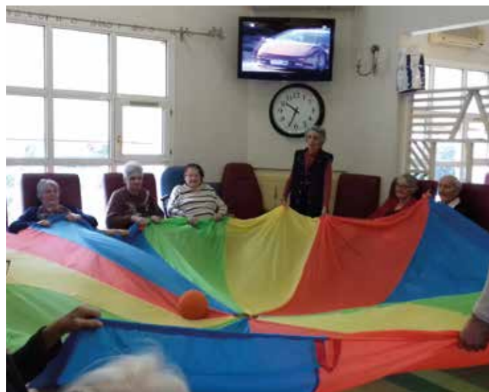
Ensemble on est plus fort !