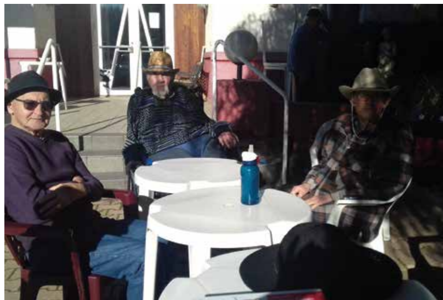
L'Ensoleillade a des airs de Western...