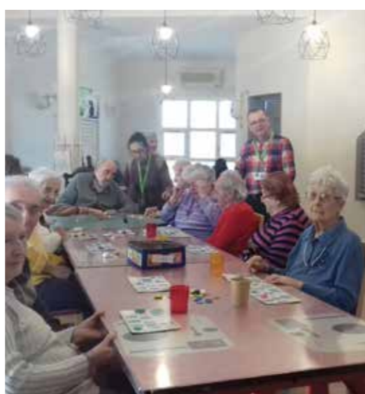
Le loto des fleurs avec l'association VMEH