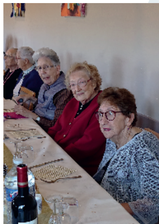
Repas du nouvel an