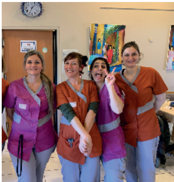
Une équipe de choc pour les fêtes