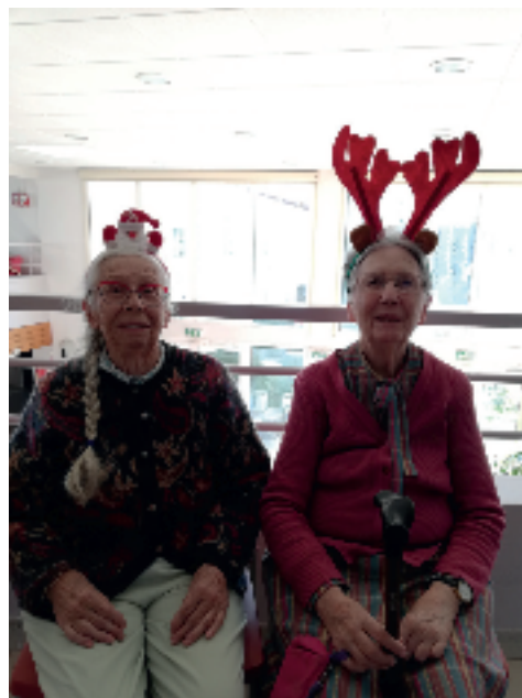
Des résidentes qui n'ont peur de rien...