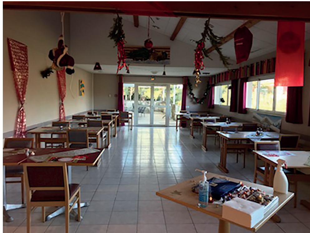
La salle de restaurant et ses décors de Noël