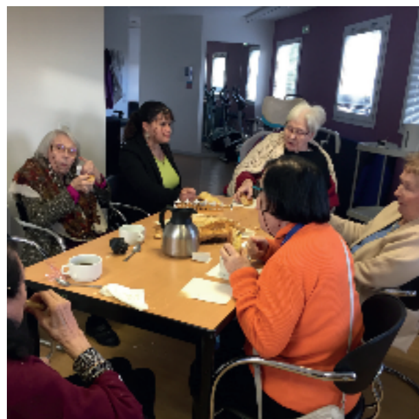
Tous autour de la galette.