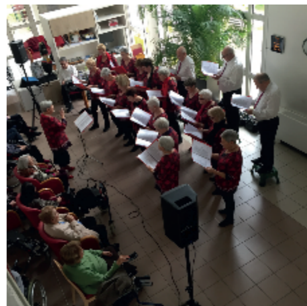
La chorale « Le cœur des Baladins ».