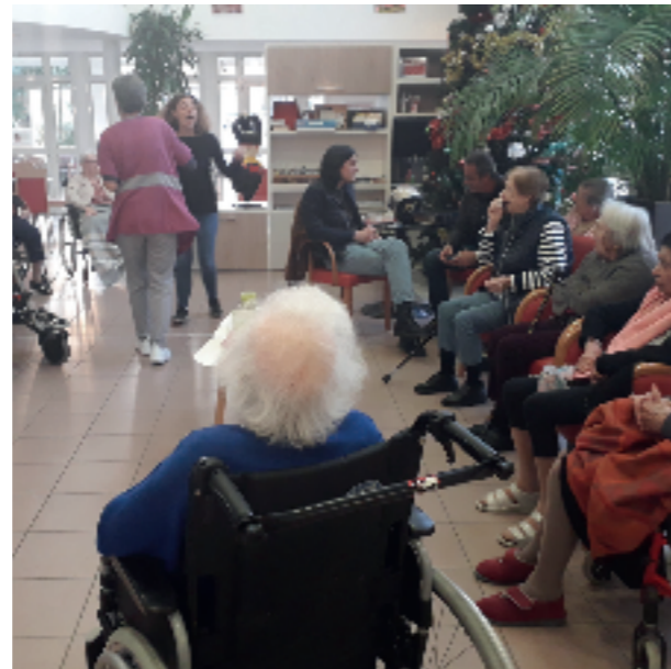
2019 se termine. Place à 2020 !