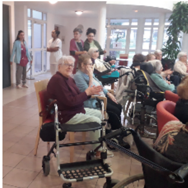
Une fin d'année 2019 en chanson !